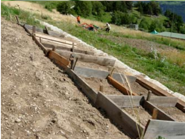
In diesen Rahmen finden die seltenen Arten der Begleitflora ihren Platz. oben: Spatzenzunge, rechts: Venuskamm

Sortengarten als Ort, wo viele dieser Arten vorkommen und gepflegt werden. Speziell Wert lege ich darauf, dass das Saatgut aus ursprünglichen Vorkommen aus dem Wallis stammt.