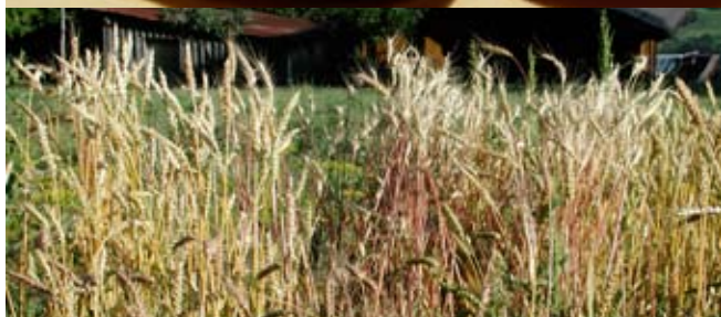
Grossbohne (Ackerbohne); 3 Weizensorten nebeneinander

als auch für die Einlagerung zur Verfügung. Ich baute fast 180 verschiedene Sorten an, auf einer Fläche von je 0.5 -5 m 2 pro Sorte.