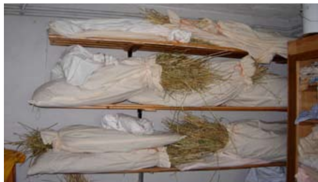
Die Weizensorten werden vor dem Dreschen gelagert. Sie können in dieser Phase noch etwas nachreifen.

Abwehrmassnahmen (zudecken mit Netzen, verscheuchen) gab es Verluste. Vorher schon entwickelten sich die Sorten an einzelnen Orten schlecht.