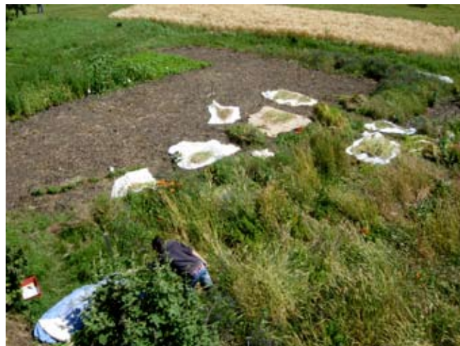
Die Weizensorten werden geerntet, bevor die Spatzen alles abräumen

Es gab Probleme mit Vögeln. Vor allem im Feld vor dem Haus, mitten im Dorf, haben sich ganze Spatzenschwärme am Weizen bedient. Trotz verschiedenen