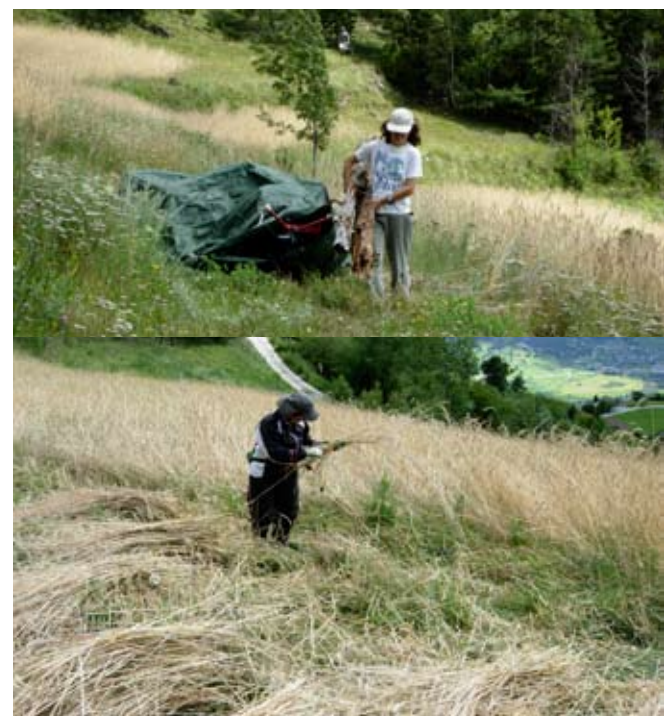
Freiwillige im Einsatz: Aufräumen und Ernten des Roggens von Hand (dort, wo er stark am Boden lag)

Seit einigen Jahren kann ich auf die Mithilfe einer Gruppe von Freiwilligen zählen, die mir die SUS (Stif-