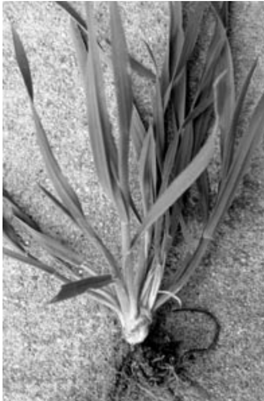
Bestockungstypen: ganz links aufrecht bestockt, links mittel be- stockt, unten ausgebreitet bestockt