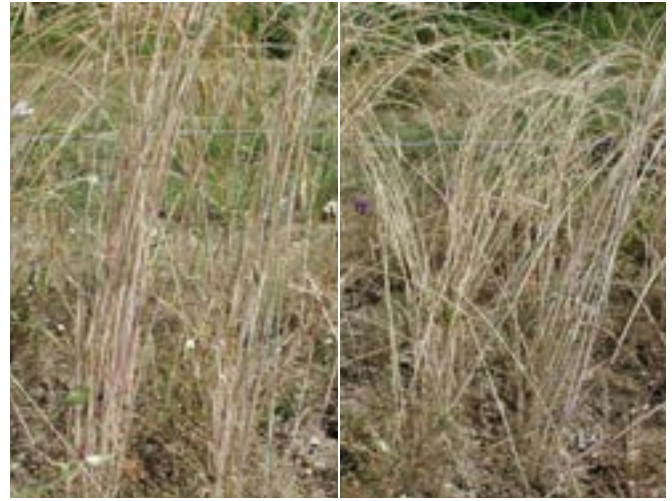
Die zwei Roggensorten WRERNE und WRLEIGG, Standfestigkeit 2 bzw. 5. Skala: 1=aufrecht, 9=liegend