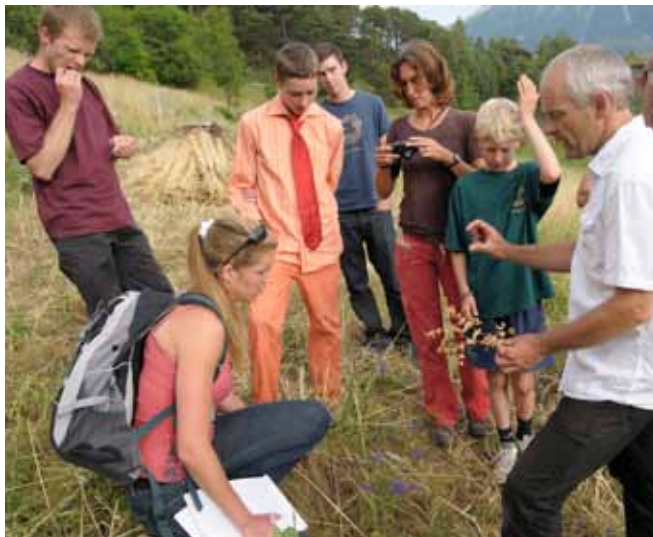
Erlebniswelt Roggen Erschmatt, Sortengarten Erschmatt - Jahresbericht 2008 - S. 9

Im Sommer dokumentierten wir die Roggenernte mit Film und Fotos. Wertvolles Material, denn die Leute, die dieses traditionelle Handwerk noch beherrschen, sind nicht mehr zahlreich.