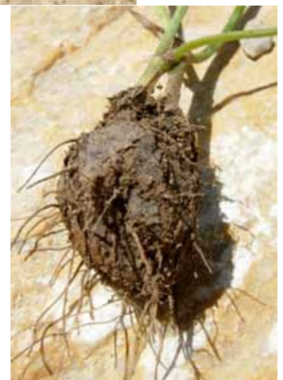
Breitsame, Spatzenzunge und Erdkastanie