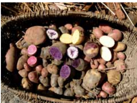
Das Backerlebnis am Welternährungstag widmete sich dem Thema Kartoffeln Rechts oben: Backtag im Mai 2008

Eine besondere Auszeichnung bedeutete im November der Raiffeisenpreis 2008 des Walliser Heimatschutzes, welcher an den Verein Erlebniswelt Roggen Erschmatt verliehen wurde. Bei der Preisübergabe wurde das Zusammenspiel der verschiedenen Angebote des Sortengartens und des Backerlebnis gelobt und mit einem schönen Preisgeld belohnt. So gesehen war und ist der Aufwand für die Werbung des Backerlebnis, des Sortengartens und von Erschmatt Tourismus lohnenswert und erfolgreich.