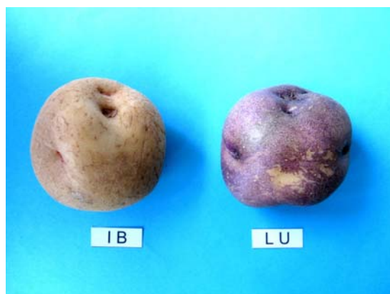
Fig. 1b. Tubercules des variétés de pomme de terre Institut de Beauvais (IB) et Lilaschalige Uetendorf (LU).