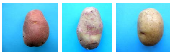
Fig. 4. Variété Fläckler, type normal (à gauche) et variants (au milieu et à droite).

En outre, la variété Fläckler présente plusieurs morphotypes différents (fig. 4) indépendamment de l'environnement de culture. Une instabilité génétique inhérente à son potentiel de croissance pourrait être à l'origine de ces diverses expressions morphogénétiques.