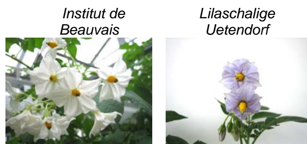
Fig. 1a. Fleurs des variétés de pomme de terre Institut de Beauvais et Lilaschalige Uetendorf .

On peine à distinguer, par exemple, le groupe de variétés Aargauer Müsli , Acht-Wochen-Nüdeli , Müsli Oberkirch et Virgule de Béroche de la variété de pomme de terre Ratte (fig. 2).