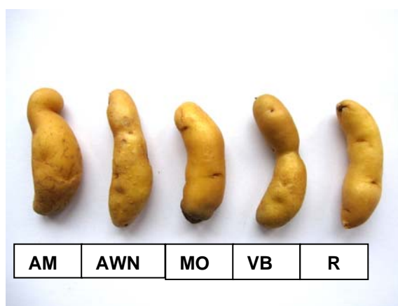
Fig. 2. De gauche à droite, Aargauer Müsli (AM), Acht-Wochen-Nüdeli (AWN), Müsli Oberkirch (MO), Virgule de Béroche (VB) et Ratte (R).

De même, les variétés Vriner, Roseval et Fläckler ressemblent fortement à la variété Désirée (fig. 3).