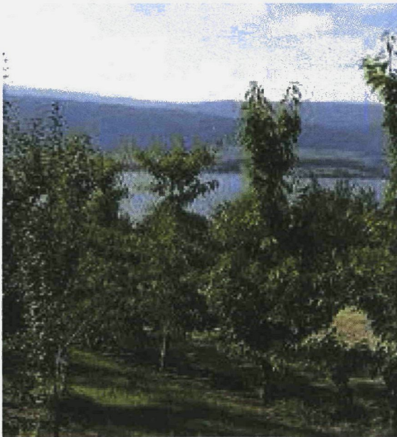
Abbildung 1: Steinobstsammlung in Lüscherz

In Lüscherz sind beide Parzellen der Steinobstsammlung gesund und in einem gut gepflegten Zustand.