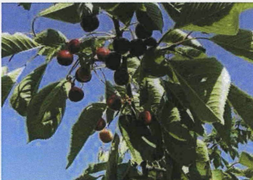
Abbildung 3: Kirsche des Jahres Schöne von Einigen

Im Sommer wählte Fructus die Kirsche „Schöne von Einigen“ zur Kirsche des Jahres. Diese Ernennung wurde während dem Chirschmueset in Wimmis BE durchgeführt.