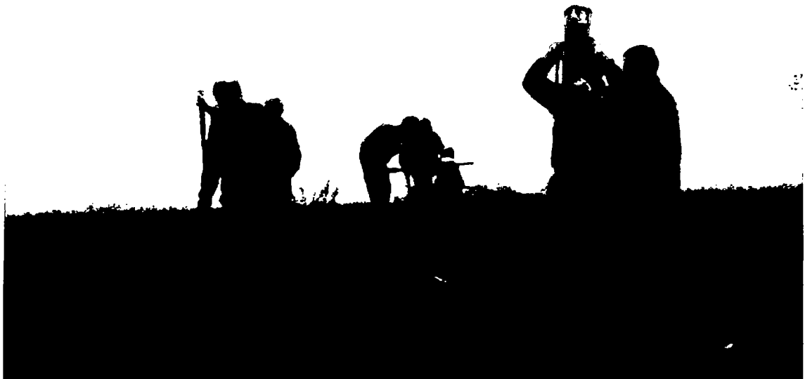
Grosse und kleine Helfer bei der Obstbaum-Pflanzung vom 21. November 2009

Im März 2011 wurden Mutationen zu den Schaffhauser Sorten des NAP-Projektes 03-71 Buchthalen in die Nationale Datenbank eingetragen. Die im November 2009 gepflanzten 20 Pflaumen- und 18 Kirschbäume als Unterlagen zur späteren Veredlung von Sorten aus Einführungssammlungen sind nicht in die NDB eingetragen worden. Auf unseren Listen und Plänen sind sie aber enthalten.