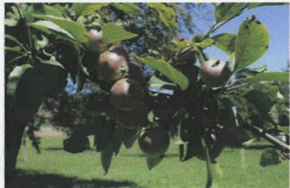
Bülleöpfeel Ende Juli