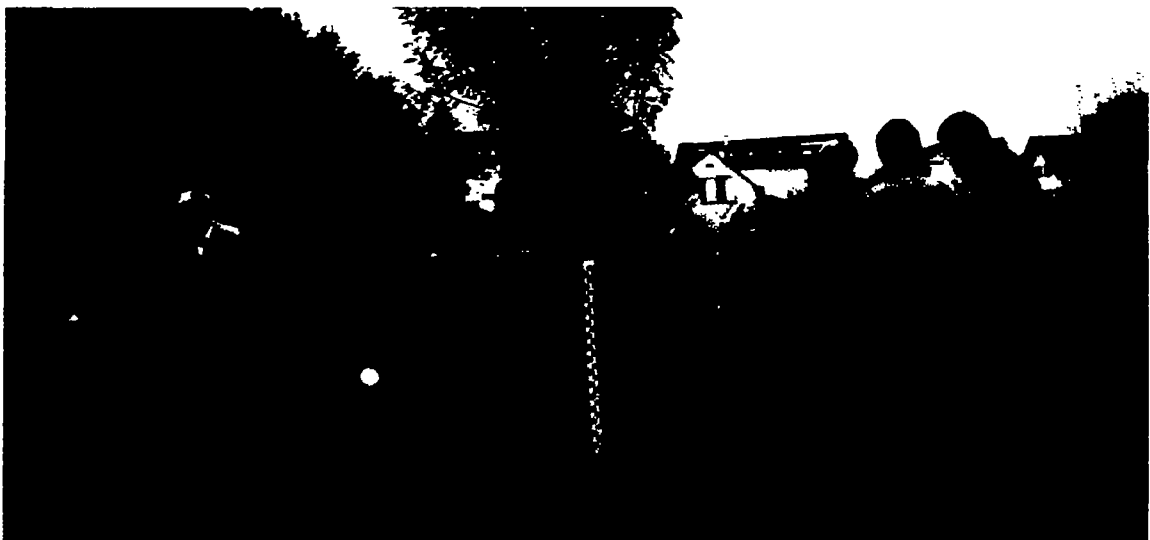
Exkursion der SKEK AG Obst vom 7. Oktober 2010 im Sortengarten Buchthalen

Ebenfalls jedes Jahr wurde für Mitarbeitende und weitere Interessierte ein Obstbaum-Schnittkurs durchgeführt. Im Laufe des Jahres fanden jeweils mehrere Obstgarten-Exkursionen für Mitglieder und Interessierte statt.