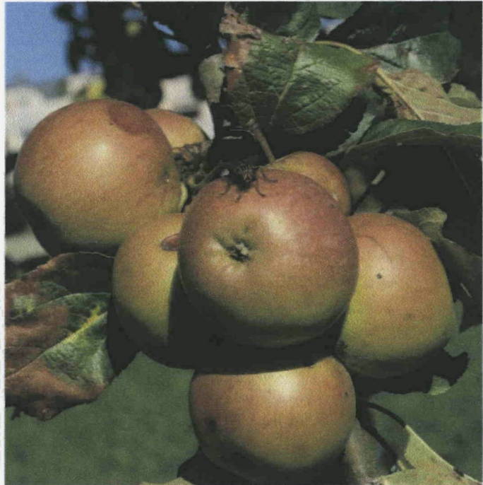
Ausschnitt aus dem Obstgarten Buchthalen Petersapfel mit dem Lokalnamen Diessenhofer Apfel