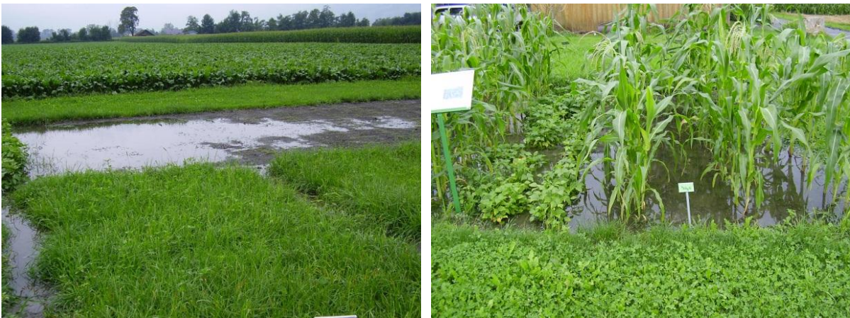
Stehendes Wasser auf dem Weizen- und Maisfeld 2010

Die nachfolgende Aufzählung der erledigten Arbeiten ist rein exemplarisch. Die Erledigung der Arbeiten war jeweils wetterabhängig. Insbesondere bei starken Niederschlägen konnte es zu wetterbedingten Verzögerungen kommen. 2010 wurde ein Teil der Ernte durch die starken Niederschläge und die tiefen Temperaturen vollkommen vernichtet.