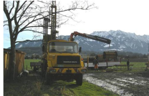
Bewässerungsanlage wird eingebaut