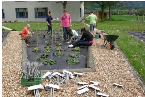
Neue Beschriftungen und Schilder