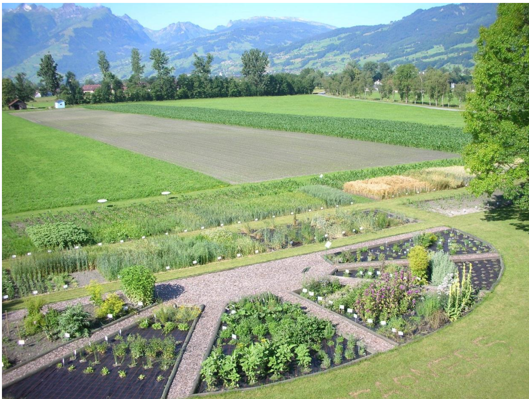
Panoramabild vom Sortenschaugarten Rheinhof

Seit seiner Umgestaltung im Jahr 2007 haben den Sortenschaugarten mehr als Tausend Landwirte und andere Interessierte besucht. In den letzten vier Jahren konnten jedes Jahr steigende Besucherzahlen verzeichnet werden. Zugenommen haben insbesondere die Besucherzahlen aus landwirtschaftsfernen Wirtschaftszweigen. Regelmässig konnte auch die Kantine des LZSG Rheinhof mit frischen Kräutern versorgt werden. Besonderes Augenmerk bei der Bepflanzung wurde auf die grosse Vielfalt der alten Kultursorten gelegt mit dem Zweck die Besucher auf die Nachhaltigkeit der Ackerpflanzen und Kräuter zu sensibilisieren. Während der vergangenen Phase hat die Zusammenarbeit mit dem LZSG Rheinhof für den Sortenschaugarten Rheinhof grosse Vorteile gebracht. Einerseits dadurch, dass das ganze Jahr über qualifiziertes Personal des LZSG Rheinhof für die Pflege des Gartens und zur Beratung der Besucher zur Verfügung stand und andererseits, dass auf den Maschinenpark und die Anbaufläche des LZSG Rheinhof zurückgegriffen werden konnte.