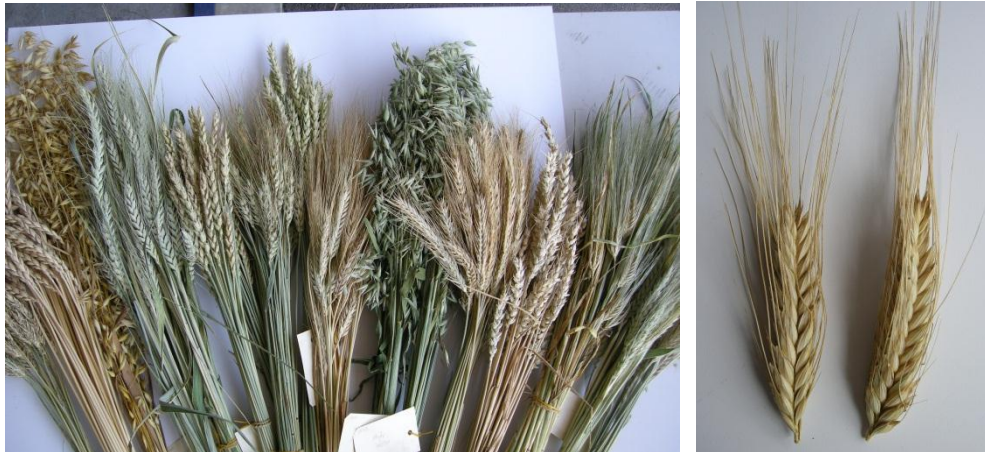
Triticum: div. Arten