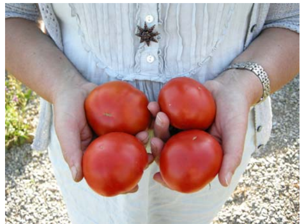
Tomate de Paudex