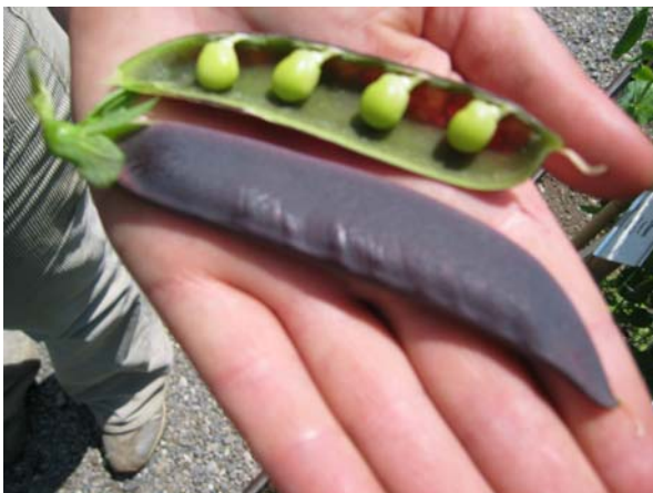
Erbse Blue Pod

Die Beliebtheit von alten Sorten mit Gourmet Status ist weiter auf dem Vormarsch. Die Vermarktung ist jedoch schwierig und braucht eine längere Anlaufzeit und Geduld.