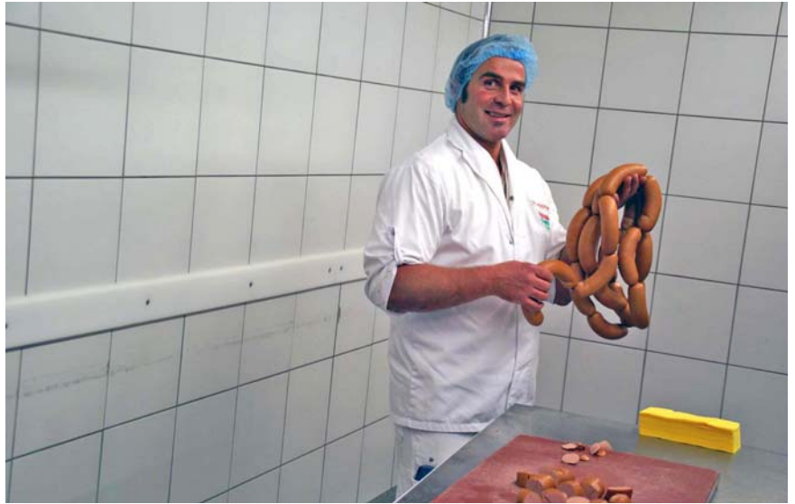
Der Fleischverarbeiter Reber AG in Langnau BE produziert Cervelats und andere Fleischprodukte. Der Agrarfreihandel mit der EU ist nicht erwünscht. (hs)

Bei offenen Grenzen könnten die Schweizer Bauern billiger produzieren und die Metzger könnten folglich das Schlachtvieh auch billi-