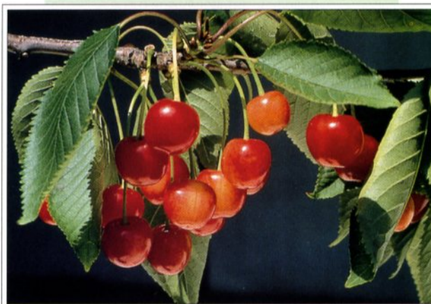
▲ La Suisse est très riche en variétés de cerises, ici la «Rouge à Kirsch» de Denens.