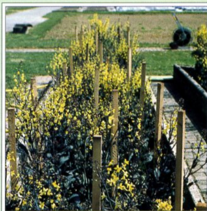
▲ Production de semence de choux pour la banque de gènes à Changins (photo RAC).

Les ressources génétiques représentent, avec le sol et l'eau, les bases de la sécurité de l'alimentation mondiale. Elles sont à la fois l'élément dont on tient le moins compte et celui qui dépend le plus de nos soins et de nos efforts de conservation. De ce fait, les ressources génétiques méritent d'être sauvegardées.